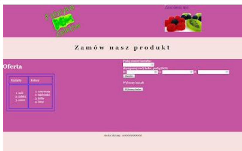
Obraz 2. Witryna, podstrona Zamówienie